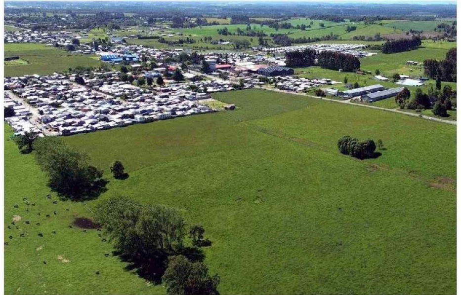
EN UN TERRENO DE NUEVA BRAUNAU, CEDIDO POR EL SERVIU AL MUNICIPIO DE PUERTO VARAS, SE CONSTRUIRÁN VIVIENDAS SOCIALES.

que entró en vigencia el actual plan regulador comunal de Puerto Montt.