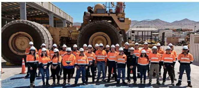
Thiess busca ser un socio estratégico clave para el futuro de la minería en Chile.

Consciente de la importancia que hoy tiene la sostenibilidad en la gestión empresarial, la compañía ha incorporado los riesgos climáticos y las