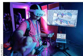
La UDLA exhibió una aplicación de realidad virtual que ayuda a personas de la tercera edad con deterioro cognitivo. Todos los asistentes la pueden probar.