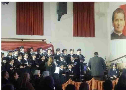
Las alumnas ofrecieron a los asistentes su destreza vocal en el canto.