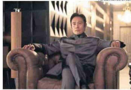
FOTOGRAMA DE LA SERIE

“Creo que la respuesta que ha recibido ‘El juego del calamar’ es la más grande de cualquiera de los proyectos en los