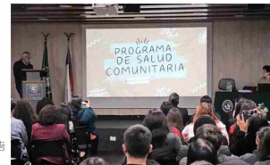
El Programa de Salud Comunitaria se imparte en todas las facultades de Salud de la UST, de Arica a Puerto Montt.