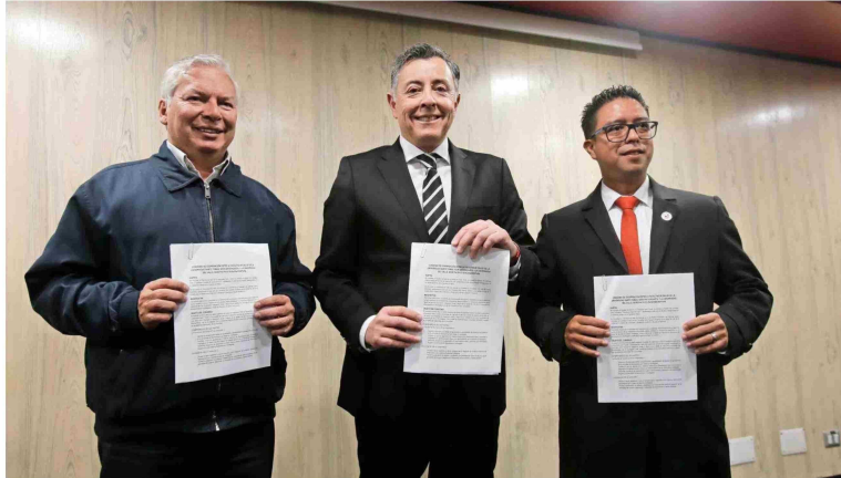
Autoridades de la Universidad Santo Tomás y Universidad del Valle (Colombia) firmaron el inédito convenio.