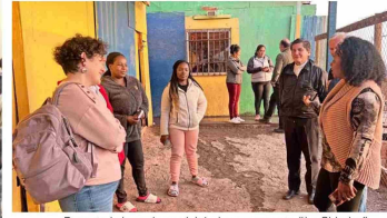
Durante la jornada se visitó el campamento "La Chimba" donde viven muchas personas de Buenaventura.