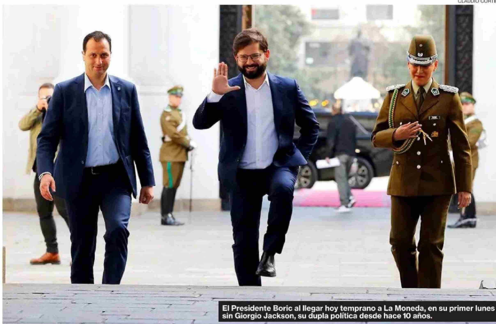
El Presidente Boric al llegar hoy temprano a La Moneda, en su primer lunes sin Giorgio Jackson, su dupla política desde hace 10 años.

En las filas oficialistas no necesariamente creen que deban caer más cabezas