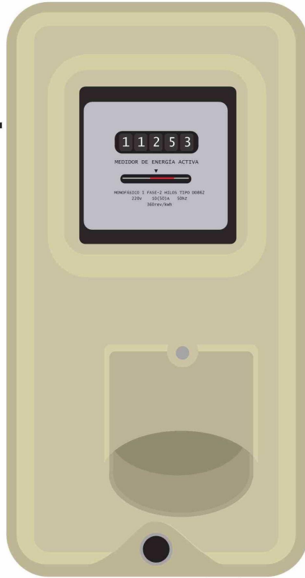
ILUSTRACIÓN: ANDRÉS OREÑA P.