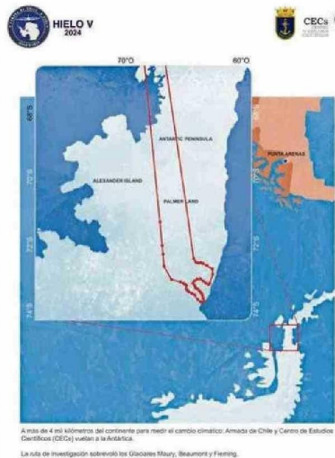
A más de 4 mil kilómetros del continente para medir el cambio climático: Armada de Chile y Centro de Estudios Científicos (CECS) vuelan a la Antártica. La ruta de investigación sobrevoló los Glaciares Murray, Staurum y Fienberg.

2 sistemas desarrollados en Valdivia tiene el avión P3 usado en la misión: un LIDAR para medir topografía y un radar de penetración de hielo.