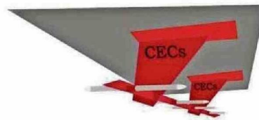
Detalle de las antenas del Radar de Penetración de Hielo, adosadas a las alas del P3 Orion ACH.

Radar de Penetración de Hielo: Alcance máximo de 3.500 metros bajo la superficie del hielo. Desarrollado por el Centro de Estudio Científicos (CECS).