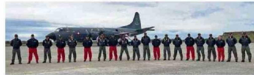
EL EQUIPO DE GLACIOLOGÍA DEL CECS Y EL DE LA ARMADA REALIZARÁN UN TOTAL DE CUATRO VIAJES DE EXPLORACIÓN ESTE 2024.

En esta misión será de fundamental importancia la detección de las líneas de costas (grounding line) del lado oriental-sur de la Península Antártica.