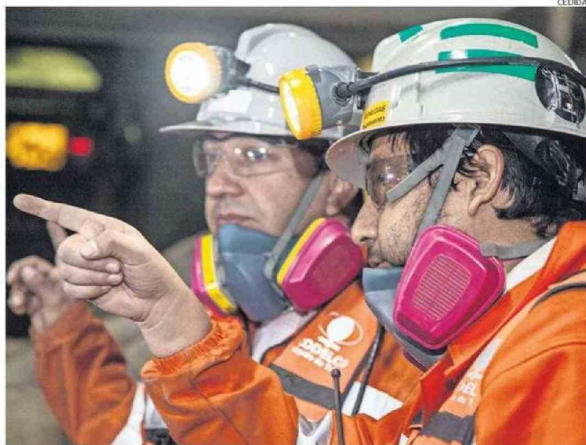
CERCA DE 9 MIL MANTENEDORES Y OPERADORES, ENTRE OTROS TRABAJADORES, REQUERIRÁ LA REGIÓN AL 2032.

Los perfiles con una mayor brecha entre la demanda y la oferta formativa son el perfil de mantenedor mecánico, operador de equipos móviles, y operador de equipos fijos, así como de supervisores de mantenimiento. En el caso de la región, la demanda requerirá en los próximos ocho años de 4.178 mantenedores mecánicos; 2.074 operadores de equipos móviles; 1.556 operadores