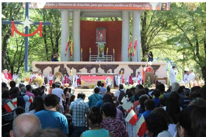
LA RELIGIOSIDAD popular forma parte de la identidad yumbelina.

Esta celebración, que no solo tiene un profundo significado religioso, sino que también resalta la rica tradición cultural que mantiene viva la identidad de esta comunidad, permite a la localidad potenciar su economía, pues emprendedores y negociantes ofrecen diversos productos para los feligreses