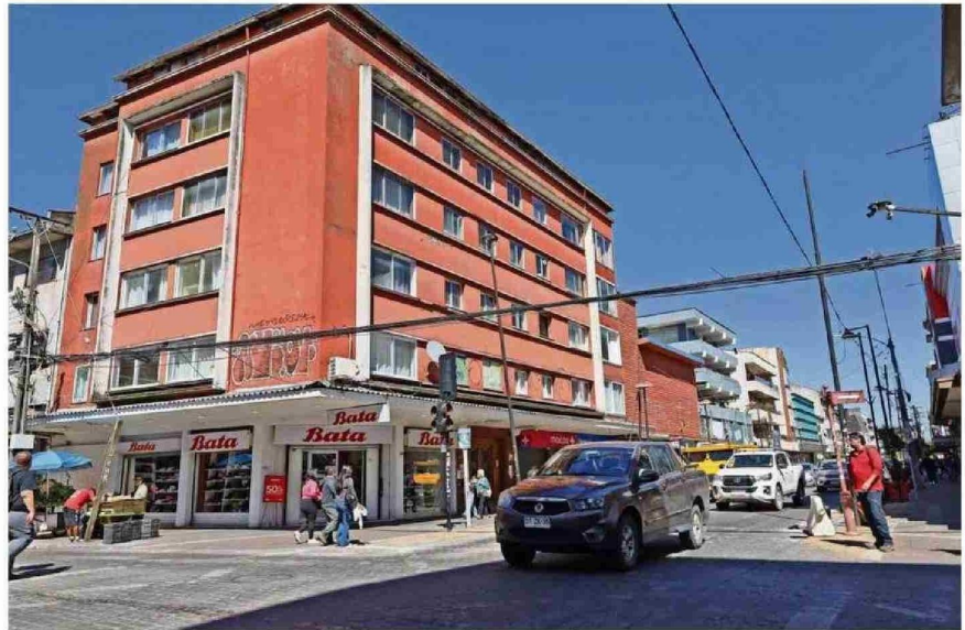
EN OSORNO HAY MUCHOS VECINOS QUE INTEGRAN COMITÉS ESPERANDO POR UNA VIVIENDA, DICE LA PRESIDENTA DEL COMITÉ DE ALLEGADOS.

Sin embargo, destaca los proyectos en los que han podido avanzar. "Tenemos a Antulayén I y II, y hace pocos días se puso la primera piedra para la etapa 3. También tenemos más viviendas en el sector del