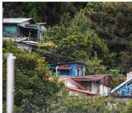
EN PUERTO MONTT, EL ALCALDE RODRIGO WAINRAIHGT APUESTA POR MODIFICAR EL PLAN REGULADOR COMUNAL.