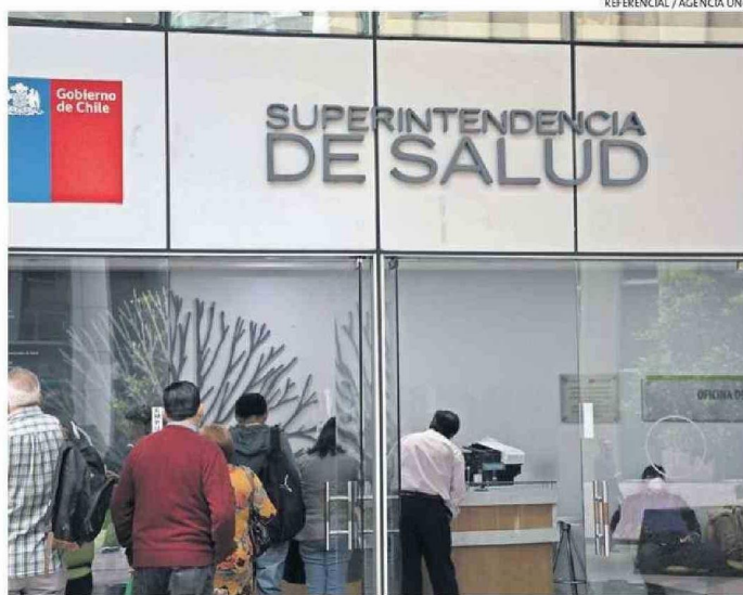
EXPLICAN QUE MUCHOS PACIENTES QUE SALIERON DE ISAPRE SIGUEN ATENDIÉNDOSE EN CLÍNICAS.