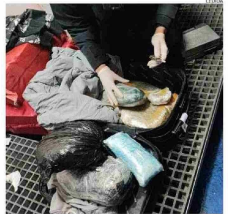
EN LA IMAGEN LA DROGA EN EL MOMENTO DEL DECOMISO.