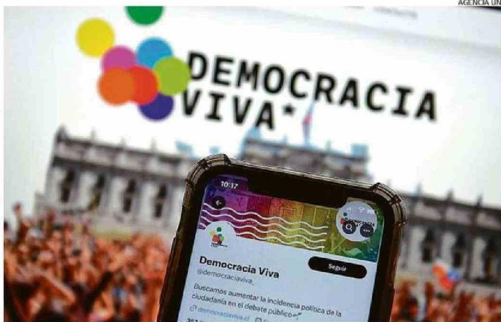
EL 14 DE JUNIO DE 2023 ESTALLÓ EL CASO QUE SIGUE DANDO QUÉ HABLAR EN RESPONSABILIDADES.