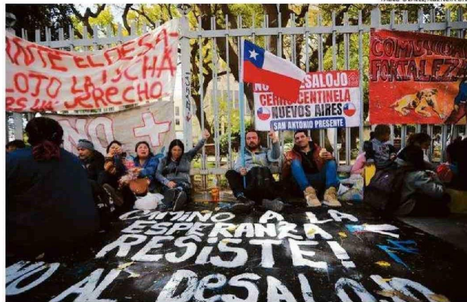
LOS MANIFESTANTES LLEGARON HASTA EL CONGRESO NACIONAL PARA RECHAZAR EL DESALOJO.

Ayer el ministro de Vivienda y Urbanismo, Carlos Montes, recordó que ante la orden de desalojo decretada por la Corte Suprema, “nosotros estamos conver-