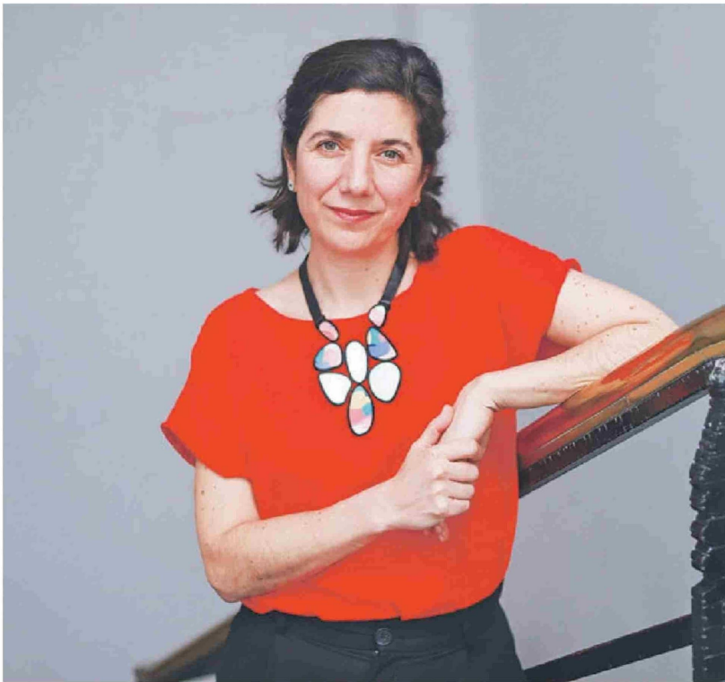
► Ministra de Ciencia, Tecnología, Conocimiento e Innovación, Aisén Etcheverry.