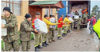
Brigada CMPC y militares del regimiento de Los Angeles descargan productos Softys para entregar a damnificados.