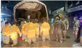
Brigada CMPC apoyando a locatarios de Los Angeles por desborde del estero Quilque.