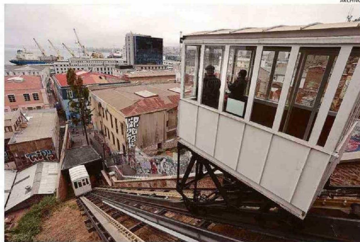
EL ASCENSOR CORDILLERA ES UNO DE LOS TRES INCLUIDOS EN EL INFORME DE LA USM.

Asimismo, dijeron que los resultados del informe "podrían eventualmente extenderse a los demás ascensores propiedad del Gobierno Regional, próximos a licitar". En concreto, el documento será entregado a