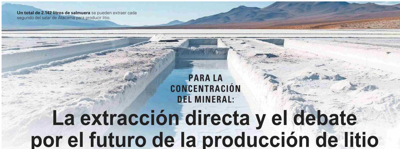
Un total de 2.142 litros de salmuera se pueden extraer cada segundo del salar de Atacama para producir litio.