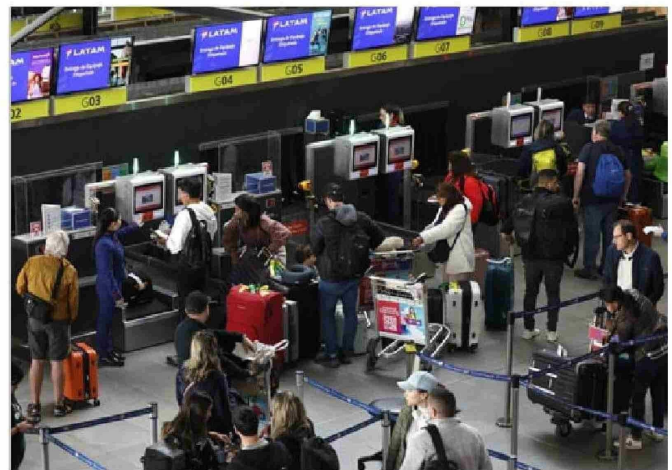
TRÁFICO AÉREO DE PASAJEROS 2018-2024

A nivel internacional, la institución contabilizó que los destinos de Sudamérica fueron los más populares con 328.801 pasajeros de los