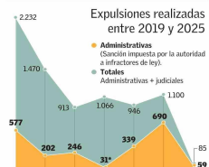
Fuente: Servicio Nacional de Migraciones. EL MERCURIO

➤ Pacientes que utilizan la modalidad de libre elección aumentan más de 30% en cinco años y superan los 8,5 millones. | C 7