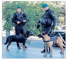
En medio de un riguroso operativo de seguridad se efectúa la formalización de cargos de cinco integrantes de la organización criminal, en el Centro de Justicia.

Banda de "Los Piratas" Desde secuestros planeados por WhatsApp hasta asesinatos por desobediencia: las brutales prácticas de la organización detrás del crimen de Ojeda