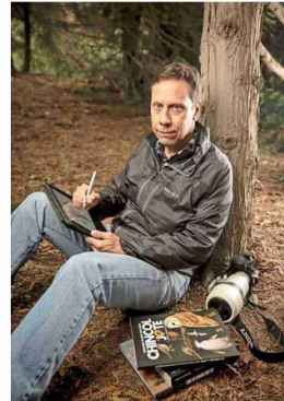
AUTOR. Rodrigo Verdugo hizo 1100 ilustraciones de más de 800 especies.