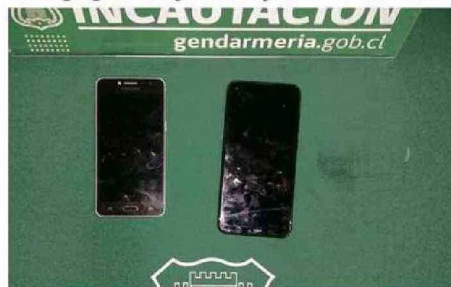
LOS EQUIPOS CELULARES QUE IBAN AL INTERIOR DEL TELEVISOR.

OPERATIVO. Mediante un escáner que revisa las encomiendas, se detectó que al interior del aparato se encontraban los equipos telefónicos y sus accesorios.