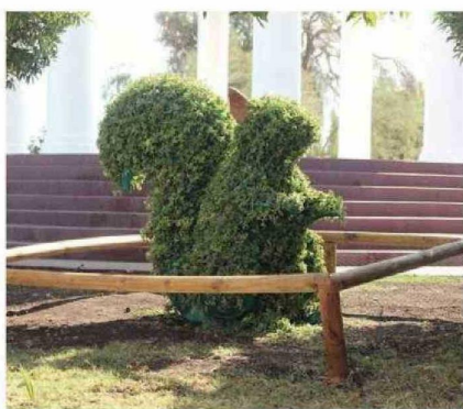
ESTAS ESCULTURAS REFLEJAN BELLOS ANIMALES.

Esta iniciativa fue impulsada por los miembros de esta agrupación, quienes en marzo pasado inauguraron otro proyecto de intervención en el Muelle Fiscal. Para esta figuras hechas con flores y plantas en la plaza recibieron el fi-