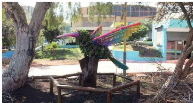
EL HERMOSO “COLIBRÍ” QUE DEJA UNA LINDA POSTAL PARA TODOS LOS VISITANTES DE LA PLAZA.

Iniciativa fue desarrollada por la agrupación Tocopillarte y entrega un hermoso espacio público a Tocopilla.