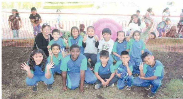
LOS PEQUEÑOS FUERON LOS MÁS FELICES EN LA INAUGURACIÓN DE ESTE PROYECTO.