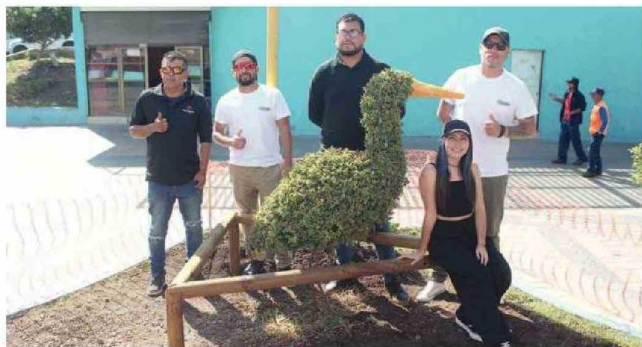
LOS INTEGRANTES DE TOCOPILLARTE JUNTO A LA PRIMERA FIGURA QUE CREARON: LA GARZA.