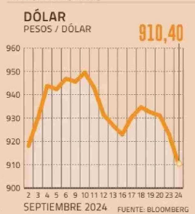
EL ÚLTIMO MES

algún tipo de acción (en China) y esto es bastante agresivo".