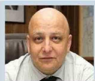
EX FLETERO DE ANGELMÓ MUERE EN INCENDIO Siniestro destruyó casa en que vivía adulto mayor de 90 años. Pág. 7

Critican baja sanción de la Contraloría a Carlos Soto