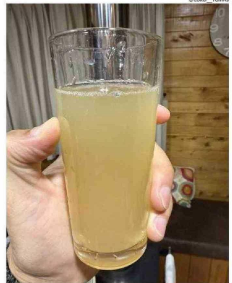
TOMÁS VÁSQUEZ PUBLICÓ EN SU CUENTA DE X (@LORD_TOMAS) ESTA FOTO MOSTRANDO LAS CONDICIONES EN QUE SE ENCUENTRA EL AGUA EN NERCÓN.