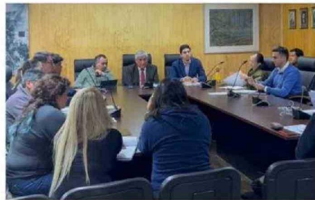
COGRID REALIZADO AYER EN EL MUNICIPIO DE CASTRO

el Servicio Local de Educación Pública (SLEP), todos tenemos que trabajar acá para que llegue a buen puerto y ojalá que las clases que comienzan mañana (hoy) puedan darse y de lo contrario hay que tener un plan de emergencia", agregó el edil, refiriéndose a los establecimientos afectados ante la situación, entre ellos el Colegio San Francisco de Asís, Escuela de Nercón y Ceduc UCN.