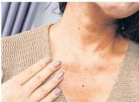
ATENCIÓN CON LAS SEÑALES QUE APARECEN EN EL CUELLO.