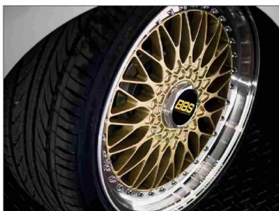
Las llantas BBS son de las más cotizadas del mercado.