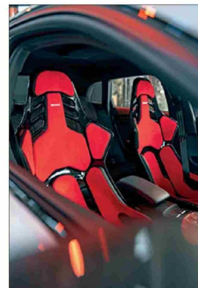
Recaro equipa autos de competición.