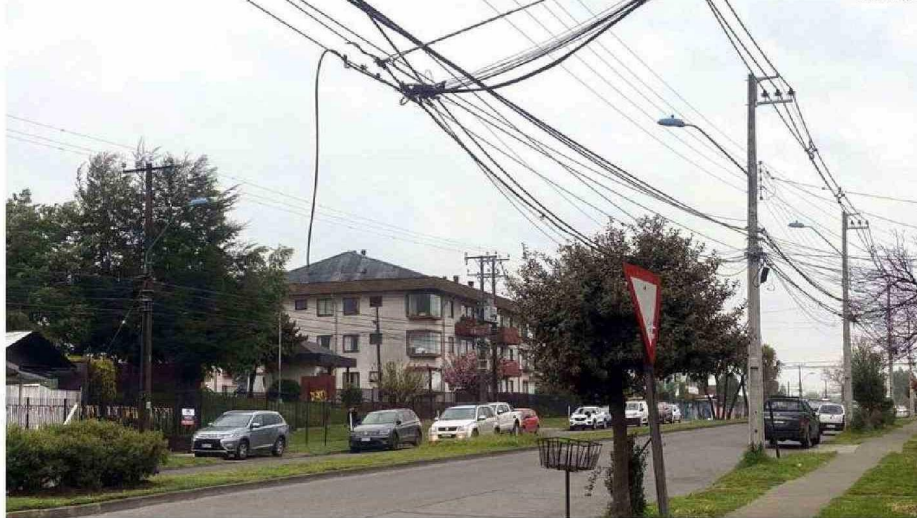
LOS CABLES VAN CAYENDO POR EL PESO Y MUCHAS VECES SON ENGANCHADOS POR LOS CAMIONES QUE PASAN, VOTANDO POSTES Y CORTANDO LA LUZ.

"Soterrar estos cables significa millones y millones de dólares para el Estado, porque los municipios no tenemos la espalda para hacerlo, aunque quisiéramos, no tenemos pre-