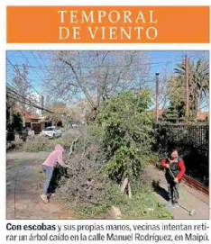
Con escobas y sus propias manos, vecinas intentan retirar un árbol caído en la calle Manuel Rodríguez, en Maipo.

TEMPORAL DE VIENTO Persiste la emergencia: El regreso de la electricidad en la RM tomará al menos hasta mañana y se suman cortes de agua