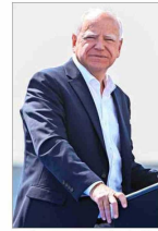
Profesor y entrenador de fútbol americano: la historia de Tim Walz, el elegido por Kamala Harris como candidato a vicepresidente. | 7

Ministro Crau alude a una "acción irresponsable" de Huachipato y Molycop por no alcanzar un acuerdo para la continuidad del complejo y llama a reconsiderar la medida.