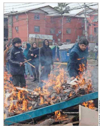
Más de 80 mil clientes se mantuvieron anoche sin electricidad en la Región Metropolitana.

Diputadas del PC desafían a aquellos que demandan terminar la alianza con su colectividad por el respaldo al chavismo y apuntan a la visita del jefe de Estado a Emiratos Árabes.