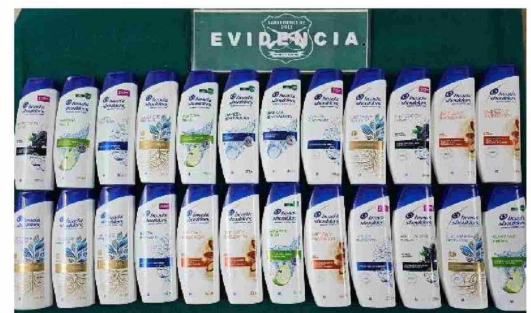
EFFECTIVOS POLICIALES recuperaron más de 20 envases de shampoo que habían sido sustraídos desde una farmacia.