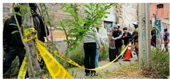
El 23 de octubre, 35 estudiantes resultaron quemados en un baño del patio "Siberia" del INBA.

cercano. "Hasta que ella empezó a traer gente para que trabajara en distintas cosas: una administradora, auxiliares... y a rearmar de a poco. En los primeros meses, igual los chiquillos seguían tirando piedras y bombas molotov al Ejército", la Escuela de Ingenieros de esa institución, que está al costado del colegio.