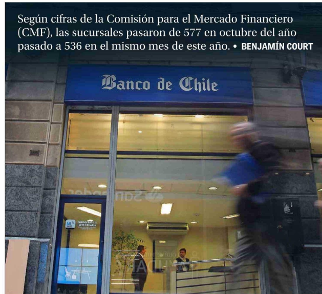
El Banco de Chile lidera la lista de cierres de sucursales durante 2023 y hasta octubre pasado.

mientos de los clientes, sin la necesidad de asistir presencialmente a una oficina.