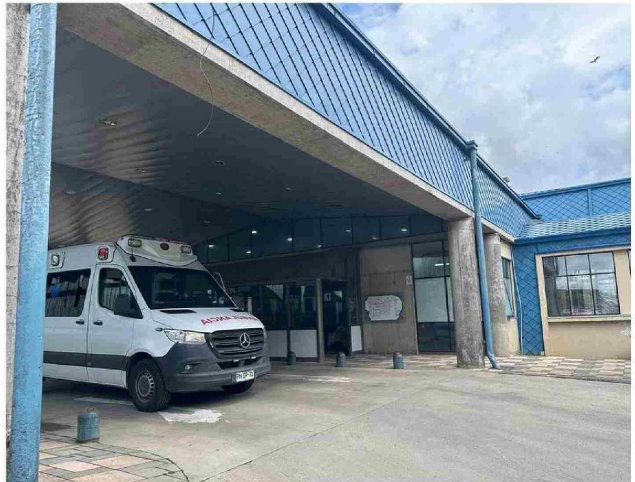
UNA MAYOR INFRAESTRUCTURA REQUIERE EL HOSPITAL DE CASTRO PARA TERMINAR CON EL COLAPSO DENUNCIADO POR DIRIGENTE.

Sobre las medidas adoptadas por la autoridad frente a la