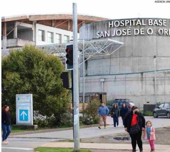
LA CONTRALORÍA DETECTÓ IRREGULARIDADES EN LAS LISTAS DE ESPERA DEL HOSPITAL DE OSORNO.