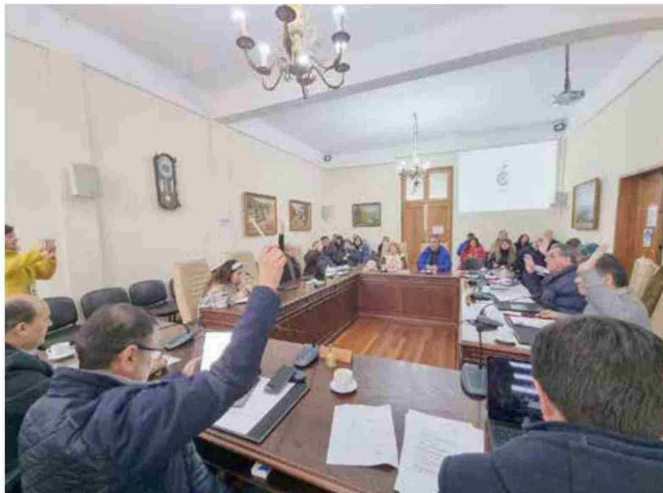
La iniciativa fue aprobada de manera unánime por el concejo municipal de Curicó.

"Este es un proyecto muy significativo, porque lo que hemos hecho durante estos años de administración, ha sido cambiar el sello completamente de lo que era la antigua Escuela Especial,