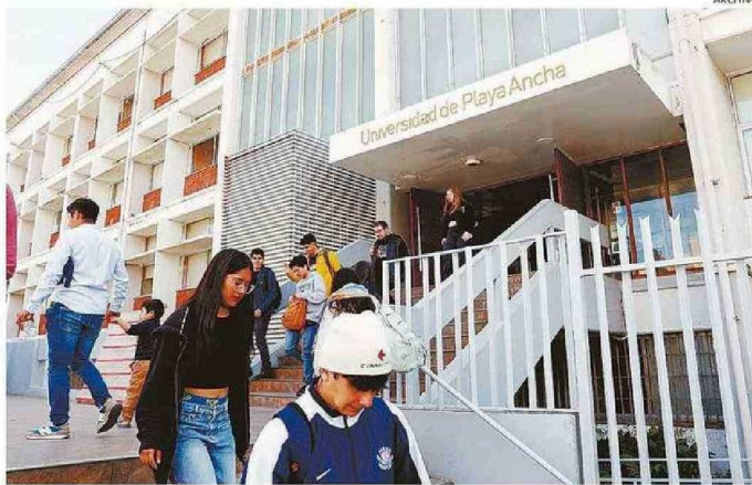
ENTRE ESTA Y LA PRÓXIMA SEMANA, LOS UNIVERSITARIOS COMENZARÁN SUS RESPECTIVAS CLASES.

En la Ciudad Jardín, en tanto, esto funciona en subida Los Lirios, lugar donde