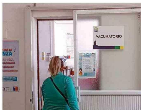
MANTENER CALENDARIO DE VACUNACIÓN PARA COVID ES CLAVE.

En tanto, desde la Seremi de Salud de la Región de