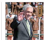
De concretarse la iniciativa, sería el exmandatario que obtendría más rápido el reconocimiento.

Cuestionan uso de recursos de la entidad: recibe $47 millones al mes y tiene 16 funcionarios, pese a estar inutilizable hace más de cinco años. | C 5