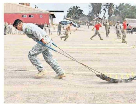
PARTICIPACIÓN EN PRUEBAS DE CROSSFIT MILITAR.