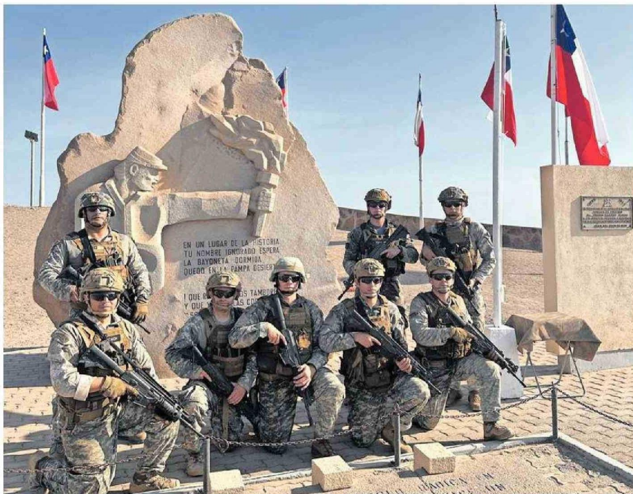
BRIGADA PARTICIPÓ EN PRUEBAS COMBAT FITNESS TEST (CFT).