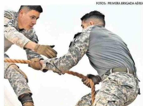
DESTACÓ EN TODO MOMENTO EL TRABAJO EN EQUIPO.