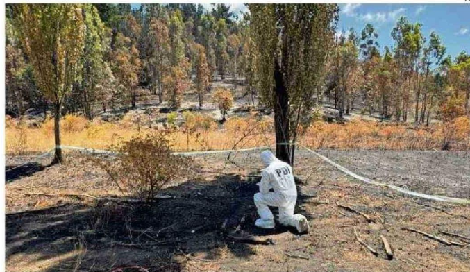
LA PDI REALIZA DILIGENCIAS PARA ESTABLECER EL PUNTO Y FORMA DE ORIGEN DEL FUEGO.

"En este trabajo previo que hace Conaf, al parecer fue una pelea entre vecinos que terminó