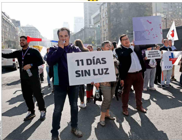
El Proceso Voluntario Colectivo (PVC) se inició luego de los prolongados cortes de luz que hubo en agosto de 2024.

"No hay ninguna referencia en este acuerdo a calificación jurídica de hechos de responsabilidad. Es más, el propio procedimiento voluntario colectivo, conforme a la ley, no significa que la empresa asuma responsabilidad infraccional en el marco de la Ley del Consumidor respecto de eventuales multas", agregó.