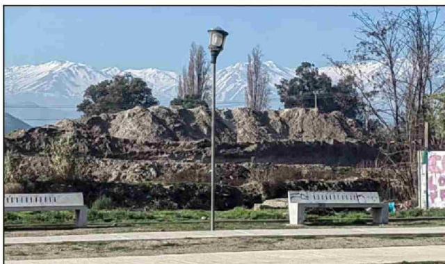
¿QUÉ ES?.- Este es el material que están removiendo, el cual debería ser analizado por las autoridades pertinentes, pues a simple vista podría tratarse efectivamente de un relave.