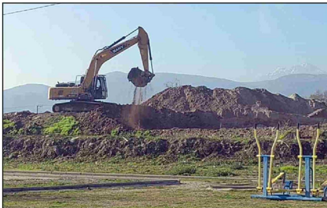
Maquinaria pesada se encuentra trabajando en el sector, removiendo el material que levanta bastante polvo y ha generado preocupación en la comunidad.

Ante las averiguaciones expuestas en esta edición, no está demás informar que el Servicio Nacional de Geología y Minería de Chile, expone en su página web que la contaminación de un relave depende directamente del yacimiento de interés y los elementos para su obtención, y que para poder saber si