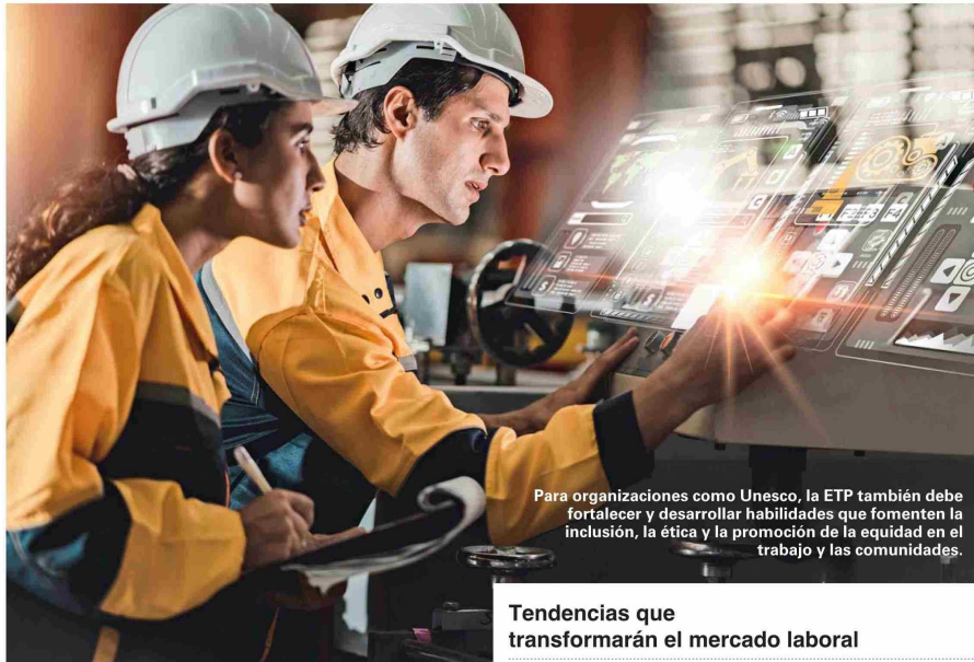
Para organizaciones como Unesco, la ETP también debe fortalecer y desarrollar habilidades que fomenten la inclusión, la ética y la promoción de la equidad en el trabajo y las comunidades.