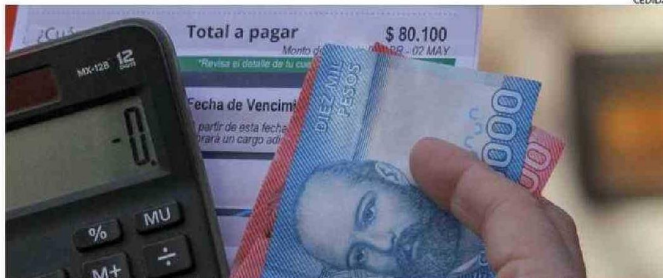
LAS CUENTAS TENDRÁN UN ALZA A PARTIR DE ESTE MES DE JULIO Y HASTA EL 2035 SE MANTENDRÁN.

las alzas en las cuentas de la luz que recibirán los clientes en sus hogares, lo que tendrá distintos impactos en la economía del hogar y del país.