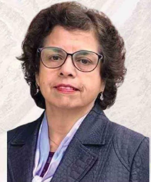
Aurora Williams Ministra de Minería

Chile, con su riqueza mineral, se presenta como un actor clave en este escenario. A través de este acuerdo con la UE, el país no solo refuerza su posición en el mercado global, sino que también contribuye de manera significativa a los esfuerzos internacionales para reducir las emisiones de gases de