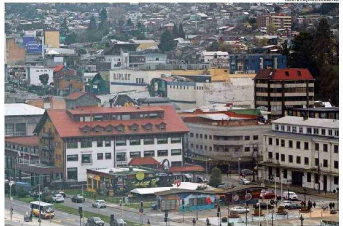
EXISTE COINCIDENCIA EN QUE TRAS ESTE RESULTADO, LA REGIÓN TIENE OPORTUNIDADES DE SEGUIR CRECIENDO.