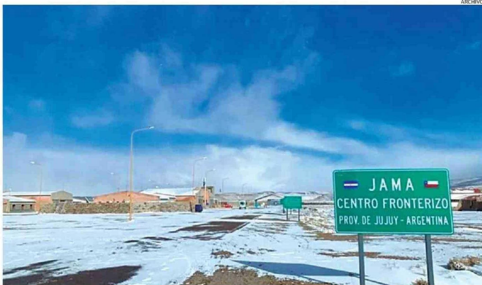
LA CNDC ALERTÓ QUE SE REQUIERE MEJORAR DE FORMA INMEDIATA LAS RUTAS QUE UNEN CALAMA CON PASO JAMA.

"No hay inversiones en una ruta que no responde al creciente tráfico de cargas internacionales, como es Jama".